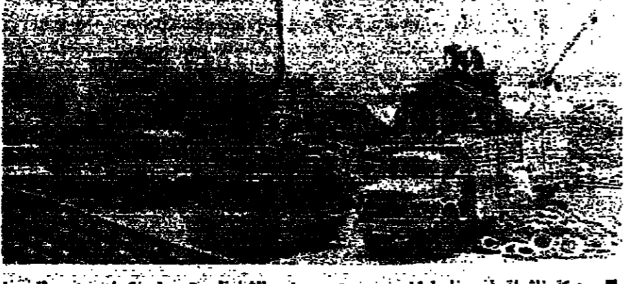
حركة ناشطة في مرفأ طرابلس... وتبدو بعض الشاحنات تحصل كيفية من دولاب

المرغا طرابلس - من مكتب «الأخبار»: هل يتجه مرفأ طرابلس، ليصبح صورة مصغرة عن مرفأ بيروت، هذا على الأقل، ما يؤكد الواقع.